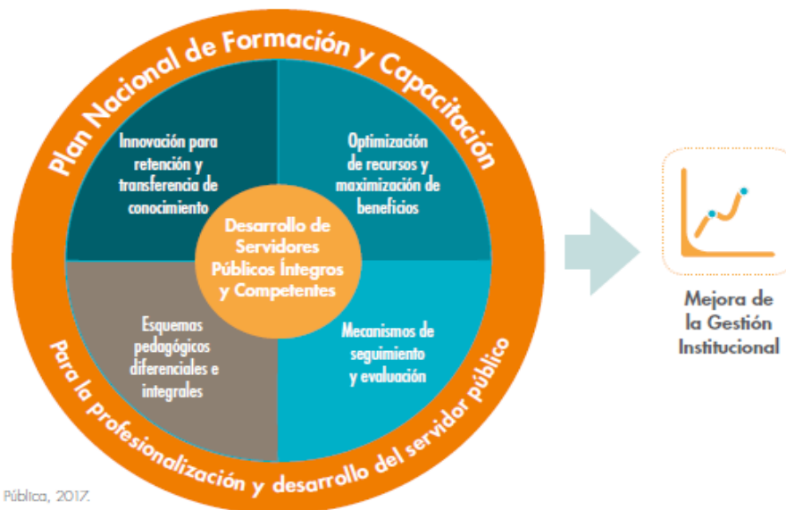
Gráfico 2. Apuesta estratégica del Plan Nacional de Formación y Capacitación

Igualmente, el aprendizaje organizacional y el uso de metodologías pedagógicas diversificadas, así como la formación descentralizada, son aportes a los esquemas pedagógicos diferenciales del Plan. En relación con los mecanismos de seguimiento y evaluación se describen las características del sistema de evaluación de la capacitación con relación al plan operativo y estratégico de la entidad.