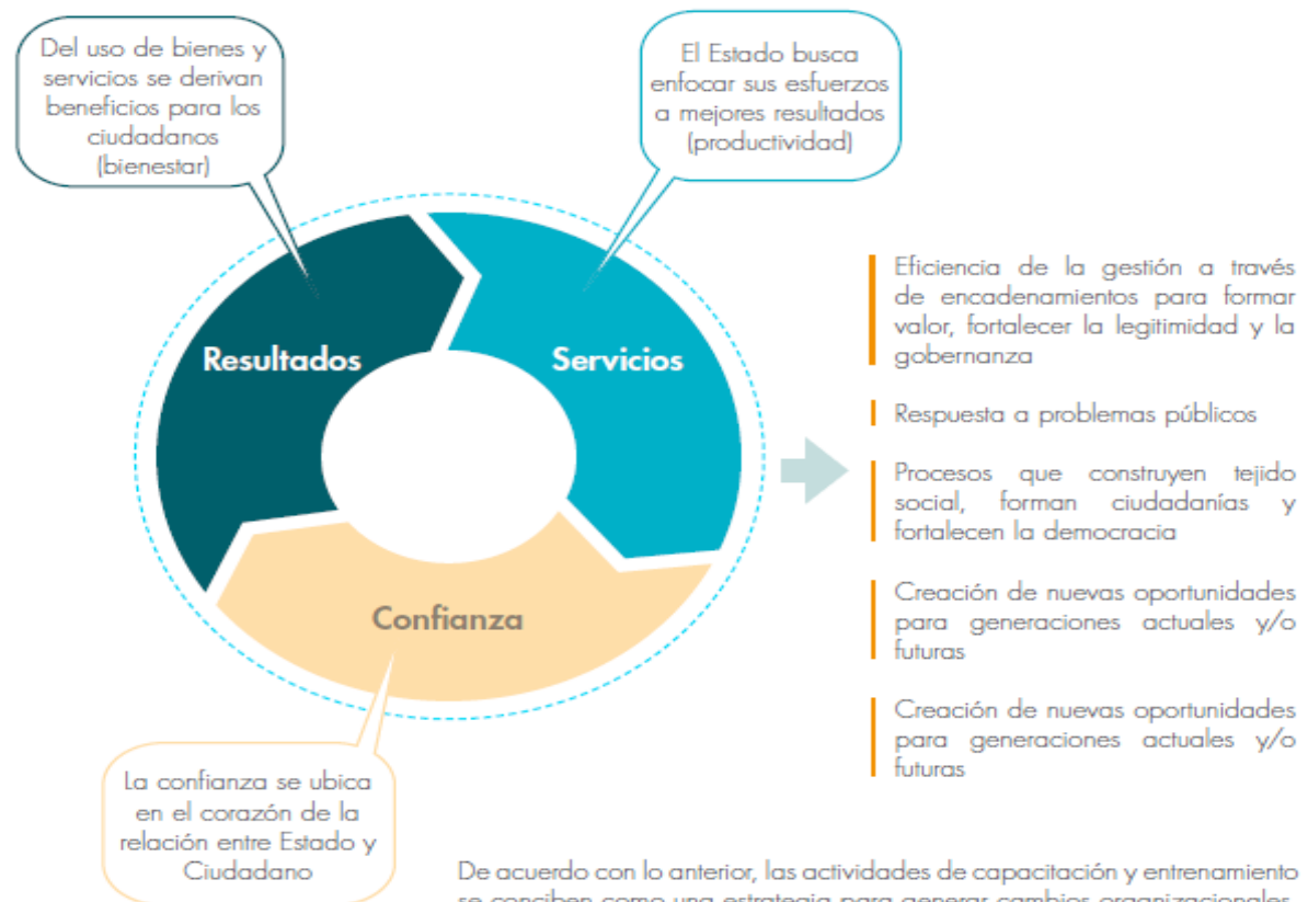
Gráfico 5. Creación de valor público