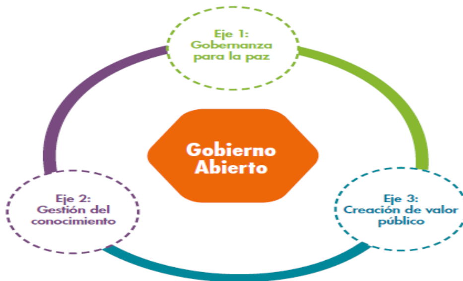
Grafico 3. Esquema de los ejes temáticos priorizados

de temáticas para desarrollar y articular programas de capacitación, orientando el fortalecimiento de las capacidades de los servidores a las necesidades institucionales en un proceso de mejora continua. Las temáticas priorizadas se han agregado en tres ejes, permitiendo así parametrizar conceptos en la gestión pública a nivel nacional y territorial para dar respuesta al diagnóstico. En el gráfico 3 se esquematizan los tres ejes y enseguida se explica en qué consiste cada uno.