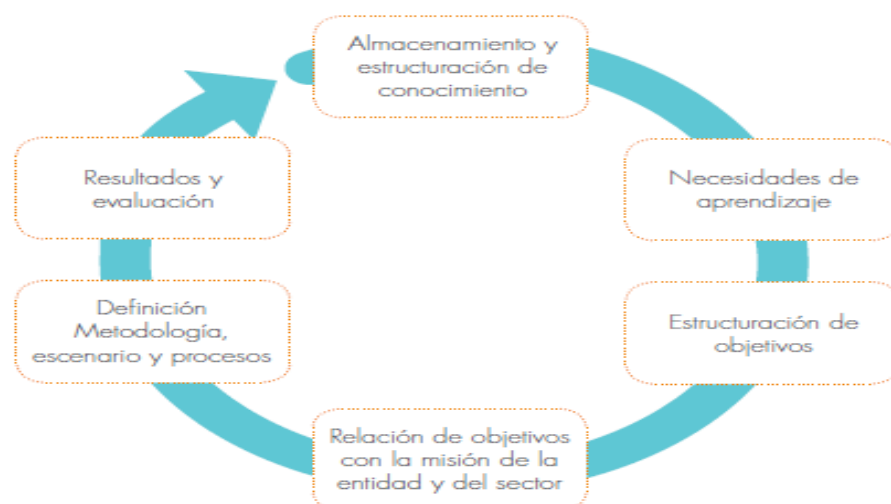
Gráfico 6. Esquema de aprendizaje organizacional en el sector público