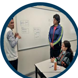
Grupo de modelos lingüísticos de LSP.

Se trabajó en paralelo en el cuaderno de vocabulario