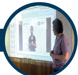
Una aplicación con un grupo de estudiantes sordos de quinto de primaria.

Se trabajó en paralelo en el cuaderno de vocabulario