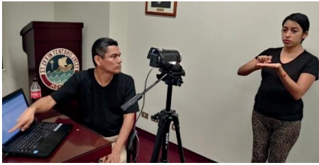
PROCESO DE GRABACIÓN

El material fue grabado por colaboradores sordos, en el campus de la Pontificia Universidad Católica del Perú y fue validado por una profesora para niños sordos en una escuela especial.